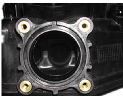
塑料件热嵌4个铜螺母