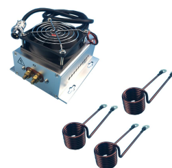
备件：电源适配器，感应线圈