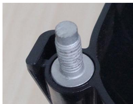
塑料件热嵌铁螺栓