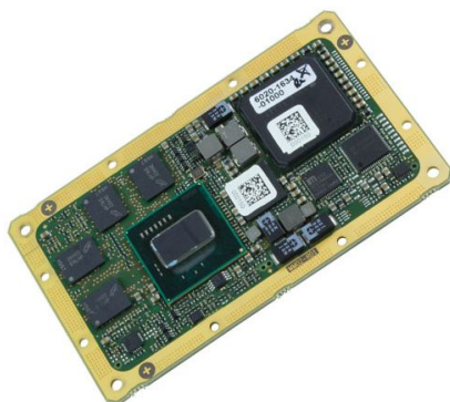
图 1 MM2 CPU 模块