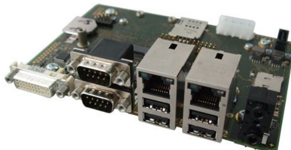
图 5 XC06 3.5 寸评估载板