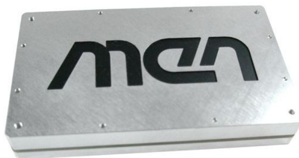
图 2 带 Frame 和 Cover 的 MM2